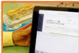
透過mLang程式，同學對學習第二語言的興趣得以提升。