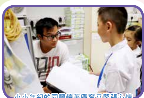
小小年紀的同學懷著興奮又緊張心情訪問校長和老師，確是一個大考驗！