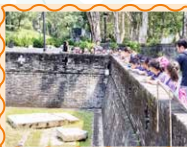
同學參觀寨城公園，導賞員向大家講解寨城的歷史，同學都聽得津津有味。