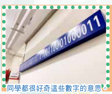
同學都很好奇這些數字的意思。