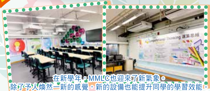
在新學年，MMLC也迎來了新氣象。除了予人煥然一新的感覺，新的設備也能提升同學的學習效能。

為了讓學生學習最新的科技，我們的MMLC進行了大改造。除了大部份的座枱電腦都轉為手提電腦外，MMLC的外觀亦跟去年大為不同。希望學生能在這個空間內享受學習資訊科技的樂趣！