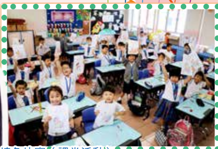
課堂填色比賽 (課堂活動)