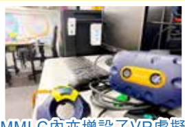
MMLC內亦增設了VR虛擬實境設備，讓同學在學校也能體驗操作VR的樂趣。

為配合STEM教育發展，本學年新增了課後VR班。同學能於班上學習設計虛擬實境程式的技巧，並設計屬於他們的遊戲，最後更能透過虛擬實境眼鏡感受自己的創作成果。同學在上課時反應熱烈，看來他們都很希望創作出獨一無二的遊戲呢！