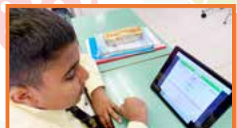
同學先自行閱讀活動指示。