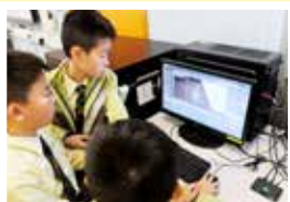
同學以3至4人為一組，合作設計遊戲，遇到困難便一起解決。果然齊心就事成！