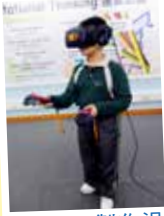
製作過程已進入測試階段，相信作品很快便能面世了！