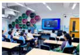
導師正在傳授同學創作遊戲的方法，同學都仔細地聆聽。