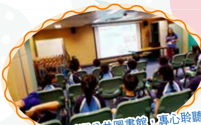
同學參觀土瓜灣公共圖書館，專心聆聽圖書館人員講解，日後就能好好善用館內的設施了。