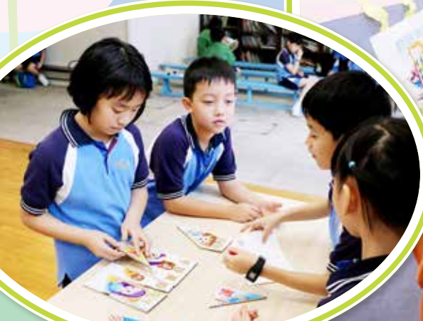
聖經故事大拼圖 (攤位遊戲)