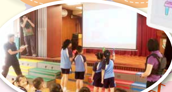
佈道會 (香港萬國兒童佈道團)