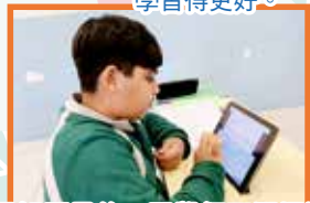
了解題目後，同學便可選擇透過錄音或文字方式回答問題。