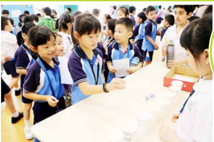
欣賞他人很容易 (攤位遊戲)