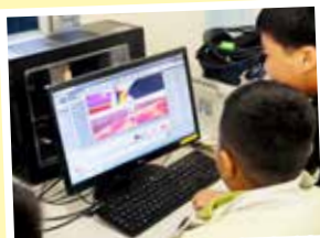
兩位五年級同學正在努力創作一個學習中文的遊戲。