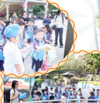
遊覽高山道公園時，同學留心聆聽老師的指示，並把筆記摘錄在參觀日誌內。