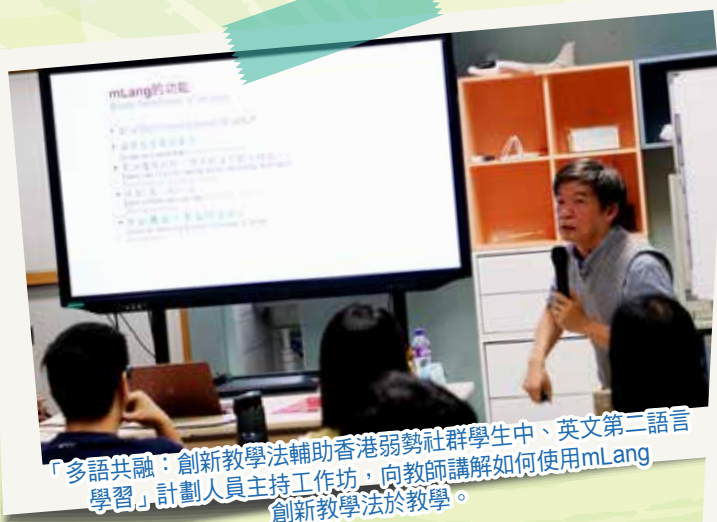
「多語共融：創新教學法輔助香港弱勢社群學生中、英文第二語言學習」計劃人員主持工作坊，向教師講解如何使用mLang 創新教學法於教學。

本校本年度參加了「多語共融：創新教學法輔助香港弱勢社群學生中、英文第二語言學習」計劃（mLang），支援中文及英文科教師，以mLang 創新教學法及科技輔助，誘發學生的第二語言學習潛能和學習的主動性，擴闊學習領域，同時支援教師的專業成長。