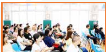
家長都專心聆聽，希望多了解這個學習程式，幫助子女更有效地學習第二語言。