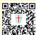
牧愛飛行訓練中心