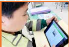
只要配上合適的圖片，便能按下提交鍵了！