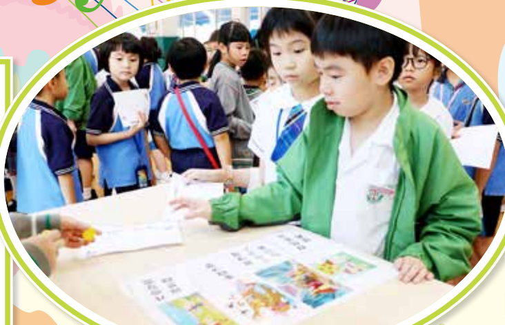
聖經故事齊配對 (攤位遊戲)