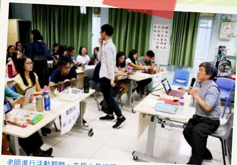
老師進行活動期間，支援人員巡視，協助如何使用mLang進行教學。