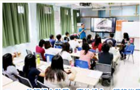
教師細心聆聽，專注投入，期望能掌握一些指導學生自主學習的有效方法。