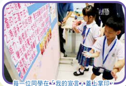
每一位同學在「我的宣言」蓋上掌印，承諾做個乖巧的孩子。