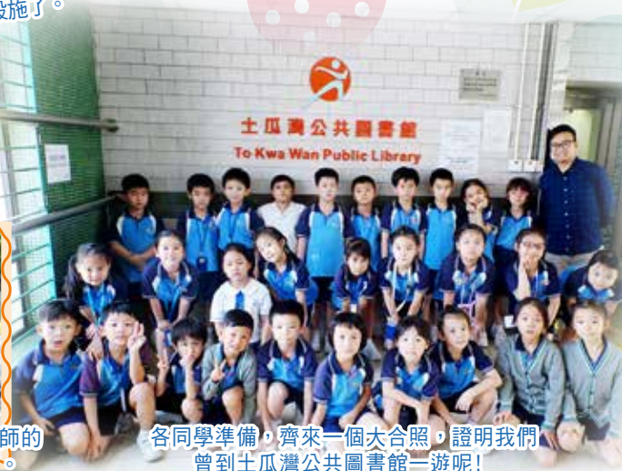
各同學準備，齊來一個大合照，證明我們曾到土瓜灣公共圖書館一遊呢！