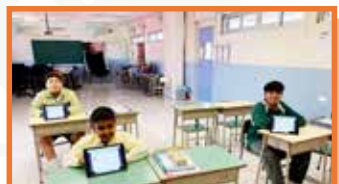
五年級非華語中文班同學在課堂上利用mLang學習中文。