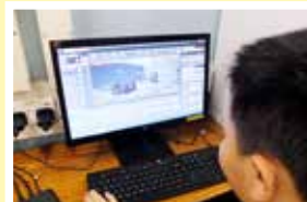
這套軟件看起來並不簡單，可是聰明的同學絕不會被它難倒。