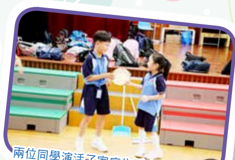
兩位同學演活了家庭生活中兄妹的角色，他們可以獲取最佳表現獎嗎？

二年級於9月25日至10月16日進行專題研習，主題為「社區與我」。透過一系列活動、遊戲及實地考察，讓學生認識九龍城區的社區設施及歷史古蹟，從而懂得欣賞和愛護社區環境、培養公德心及做個好居民。藉著多元化活動，更可訓練學生與人溝通、創意、批判、解決問題、運用資訊科技、研習及自我管理各種能力。