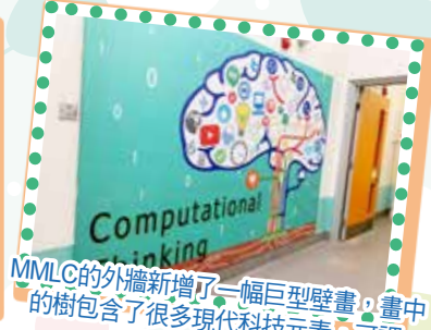
MMLC的外牆新增了一幅巨型壁畫，畫中的樹包含了很多現代科技元素，可謂非一般的樹啊！