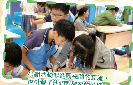
小組活動促進同學間的交流，也引發了他們對學習的熱情。