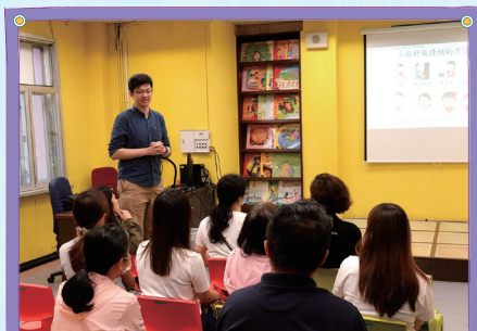
保良局的社工與家長分享辨識子女的情緒訊號及提昇孩子抗壓能力的方法。

家長溝通工作坊旨在增強家長與教師之間的交流與合作。透過互動活動和專家講座，家長能學習有效的溝通技巧，了解如何支持孩子的學習與成長。家長還可分享經驗，建立更緊密的家校聯繫，共同促進孩子的全面發展。