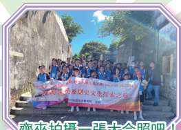
齊來拍攝一張大合照吧！