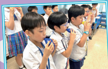
同學學會了如何用陶笛表達不同的情感。