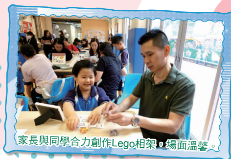
家長與同學合力創作Lego相架，場面溫馨。