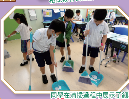
同學在清掃過程中展示了細心、觀察力及領導能力。