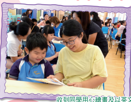
收到同學用心繪畫及以英文撰寫的心意卡，家長都非常感動。