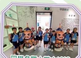
同學參觀大鵬古城博物館，深入了解深圳大鵬古城的歷史。