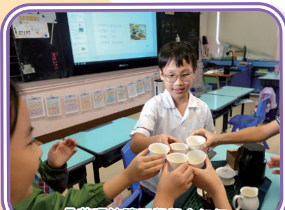
品茶環節讓同學學會如何欣賞茶的香氣和味道。