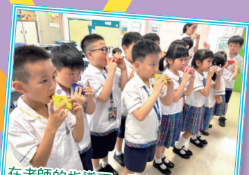
在老師的指導下，同學逐步學習演奏簡單的曲目，並在小組中進行綜合練習，提升彼此之間的默契。