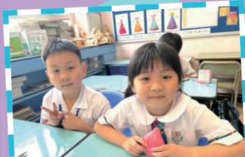
每當同學成功演奏出一段旋律時，臉上都洋溢著自信的笑容。