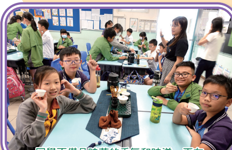
同學不僅品味茶的香氣和味道，更在品茶的过程中学會了靜心和思考。