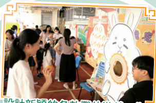
設計新穎的各款攤位遊戲，為晚會增添了不少歡樂氣氛。

每年的中秋晚會，都是同學熱切期待的大型活動，今年除了有猜燈謎、攤位遊戲、魔術表演、扭氣球、應節食品製作外，還有雪糕車到場大派雪糕，讓這晚的節日氣氛更加熱鬧，家長及同學亦歡度了一個愉快的晚上。