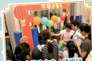
在中秋晚會中，猜燈謎是不可或缺的活動。