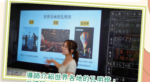
導師介紹世界各地的孔明燈，並講解孔明燈的原理。