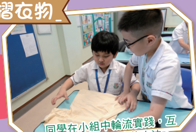
同學在小組中輪流實踐，互相比較各自的摺衣物方法。

三年級的生活技能課程旨在培養學生的獨立能力和責任感。通過這次活動，學生們不僅掌握了基本的清潔及處理衣物的技能，還增強了對家庭的責任感，為日後的生活打下了良好的基礎。