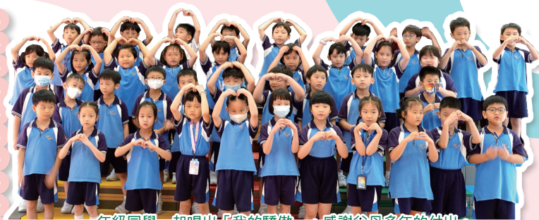
一年級同學一起唱出「我的驕傲」，感謝父母多年的付出。

一年級感恩宴活動是學校為了讓同學向家長表達感謝之情而精心策劃的一個重要活動。這個活動不僅是同學們展示學習成果的機會，更是增進家庭與學校間聯繫的重要時刻。整個活動充滿了溫馨的氛圍，同學們的笑聲和歌聲交織在一起，讓每位參與者都感受到感恩的力量。