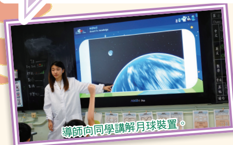
導師向同學講解月球裝置。

為提升學生的創科技能，並透過STEAM課程讓學生學習國情教育，本校特別為三年級學生安排了「未來之路：文化與科技」課程，以「月球裝置」、「孔明燈」及「倒流香」為主題，透過「動手做」，讓學生明白不同的科學原理，並加強對國家文化的認識，以歷史的深度及科技的廣度，成就學生未來的高度。