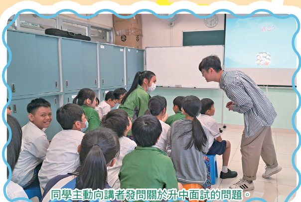
同學主動向講者發問關於升中面試的問題。

為了協助六年級同學在升中自行分配學位階段及生涯規劃作好準備，本校舉辦了「升中面試技巧講座」。透過是次講座，讓他們對升中面試的形式、策略和注意事項等有更深入的了解，從而能更自信、從容地面對升中面試。