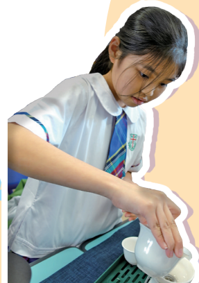
在初次泡茶時，雖然手有些顫抖，但經過老師的指導，最終成功泡出了一壺香氣四溢的茶。

茶文化是我國歷史悠久的文化之一，學生學習茶藝不僅有助於了解中華民族的傳統，更能培養他們的品味、修養和團隊合作精神。為此，我校設計了一個專為五年級同學準備的茶藝課程，旨在讓他們在輕鬆愉快的氛圍中學習茶藝知識，提升文化素養。