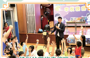
精彩的魔術表演吸引同學及家長觀看。