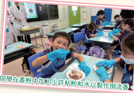
同學在香粉中加入少許粘粉和水以製作倒流香。