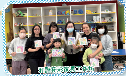
和諧粉彩家長工作坊