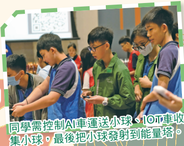
同學需控制AI車運送小球，IoT車收集小球，最後把小球發射到能量塔。

今年8月，6位同學到科學園參加「星際探索挑戰賽」透過比賽提高對人工智能、互聯網、編程和工程學等的理解。