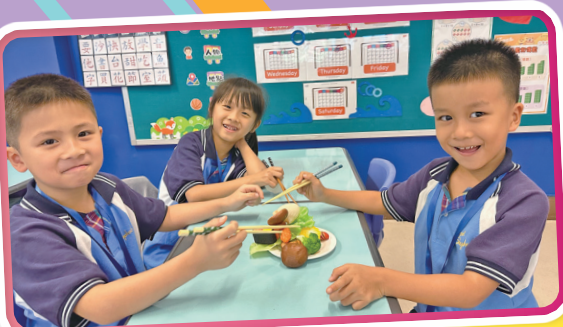
每一次能夠成功夾起「食物」，學生的臉上都流露出笑容。