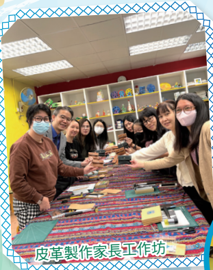
皮革製作家長工作坊

牧愛親子學堂是一個促進家庭互動與親子關係的活動平台，透過趣味課程和實作活動，家長與孩子共同學習，增進彼此理解與支持。活動涵蓋各類型的藝術創作等，讓孩子在遊戲中探索知識，同時提升家庭的凝聚力與快樂感。