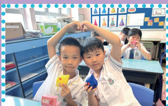
「小小陶笛演奏家課程」讓同學體驗音樂帶來的歡樂及活力。