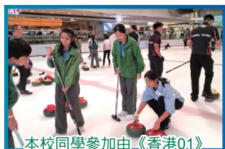
本校同學參加由《香港01》舉辦之粵港澳青年冰壺體驗活動及交流友誼賽事。