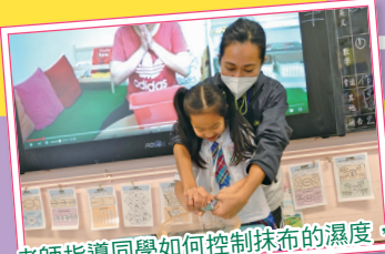
老師指導同學如何控制抹布的濕度，使抹桌子的工作變得更輕鬆。