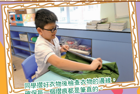
同學摺好衣物後檢查衣物的邊緣，確保每一個摺痕都是筆直的。