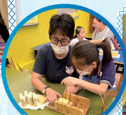
親子手工皂工作坊