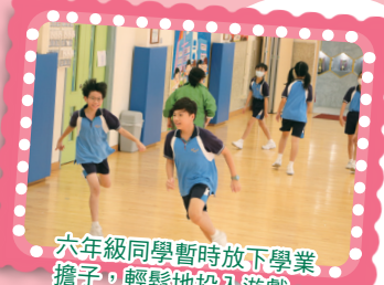
六年級同學暫時放下學業擔子，輕鬆地投入遊戲。