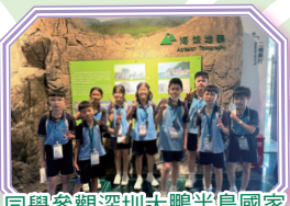
同學參觀深圳大鵬半島國家地質公園博物館，了解深圳地質資源及海蝕地貌。

讀萬卷書不如行萬里路，五年級同學透過教育局舉辦的「同根同心：深圳自然環境及歷史文化探索之旅」，參觀深圳大鵬古城及深圳大鵬半島國家地質公園博物館，既可認識深圳大鵬古城的歷史及古火山地貌，亦深入了解文物保育、環境保育和國土安全的重要性。