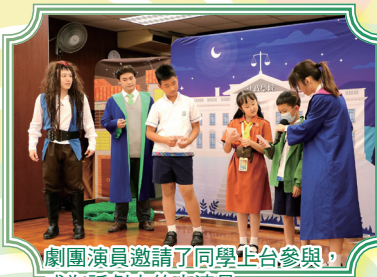
劇團演員邀請了同學上台參與，成為話劇中的小演員。

學校參加了由律政司及香港戲劇教育工作室主辦的《律政學院的冒險尋星之旅》，透過生動有趣的戲劇互動，幫助同學正確理解法治觀念，提升守法意識，並培育法治精神，以寓教於樂的方式促進法律教育。