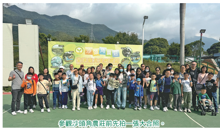
參觀沙頭角農莊前先拍一張大合照。

家教會於2024年3月舉辦了「親子農莊一日遊」，讓家長和同學深入了解沙頭角歷史和文化。當天，家長、同學、校長和老師一同參觀STK Eco Park及火車站展覽館，享受客家美食，也一嘗跳彈床及手搖船等活動。活動增進了家長和子女的親子關係，也為他們帶來歡笑和回憶。