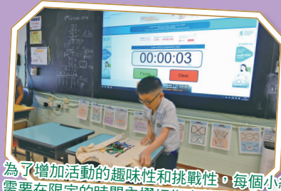
為了增加活動的趣味性和挑戰性，每個小組需要在限定的時間內摺好指定數量的衣物。