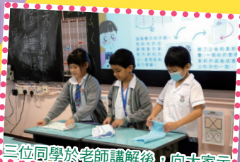
三位同學於老師講解後，向大家示範如何正確地使用濕布抹桌子。