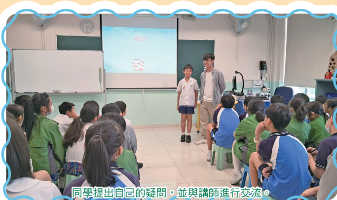
同學提出自己的疑問，並與講師進行交流。