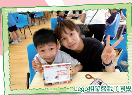
Lego相架盛載了同學與家長在牧愛的美好回憶。