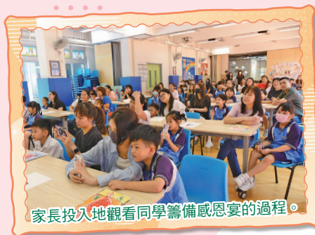
家長投入地觀看同學籌備感恩宴的過程。