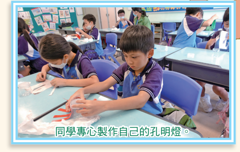
同學專心製作自己的孔明燈。