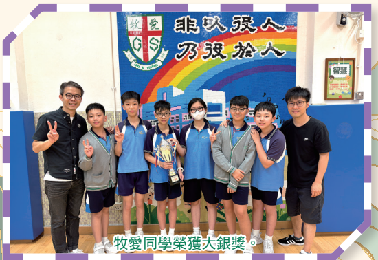
牧愛同學榮獲大銀獎。