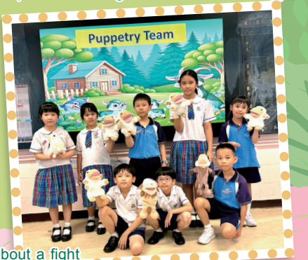
The puppetry team is preparing a Muppet show. The story is about a fight between a jackal and a sheep. We hope the students will enjoy the show.