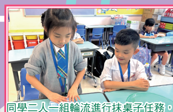
同學二人一組輪流進行抹桌子任務，互相學習。