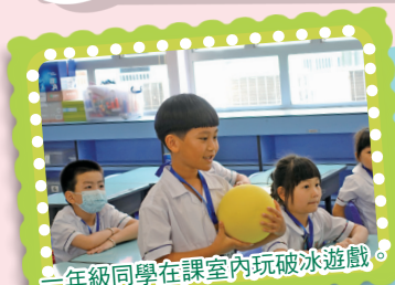
一年級同學在課室內玩破冰遊戲。