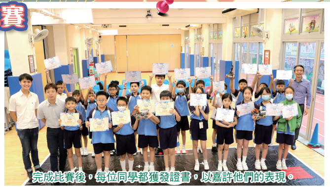
完成比賽後，每位同學都獲發證書，以嘉許他們的表現。

2024年8月26日及28日，四、五年級學生以視像形式，與惠州市第十一小學金榜分校進行姊妹學校STEAM活動交流，透過AI課程及機械人比賽，讓同學認識人工智能的發展趨勢，啟發學生探索自身的潛能，並激發同學發揮創意思維及團隊協作精神，透過兩校比賽，學生進一步加深彼此的理解和友誼，為未來的合作奠定基礎。