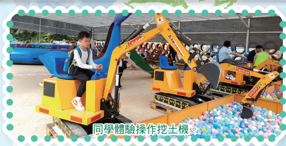
同學體驗操作挖土機。