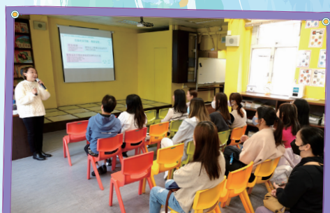
專家講解新世代家校合作的秘訣，讓家長與學校建立緊密的溝通橋樑。