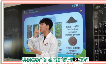
導師講解倒流香的原理，並解釋倒流香的煙往下流的原因。