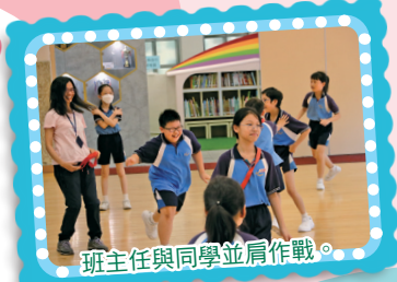
班主任與同學並肩作戰。