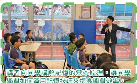
講者向同學講解記憶的基本原理，讓同學學習如何運用記憶技巧來提高學習效率。

五年級的同學正處於學習能力快速提升的階段，如何有效地記憶和理解知識成為了老師和家長們關注的焦點。為此，本校特別舉辦了「提升學習效能：記憶力」工作坊，幫助同學掌握記憶技巧，提升學習效能。