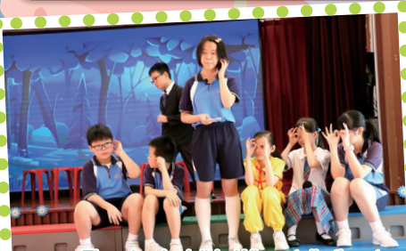
The play 'Invisible Wings' tells the story of a group of students who must perform in a school talent show. Although their parents worry that they won't be able to complete the performance, the students come together and work hard to spread their wings.

After-school English drama and puppetry activities offer students a creative outlet to express themselves. These activities enhance language skills, boost confidence, and foster teamwork. Through acting and storytelling, students explore new characters, spark their imagination, and develop a deeper appreciation for the arts.