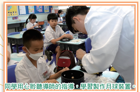
同學用心聆聽導師的指導，學習製作月球裝置。