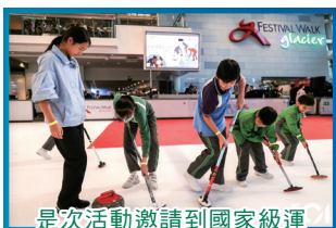
是次活動邀請到國家級運動員及粵港澳冰壺精英到港推廣冰壺運動。

為慶祝中華人民共和國成立75周年，本校六年級同學參與由《香港01》舉辦的「粵港澳青年冰壺交流活動及友誼賽」，各同學在專家指導下體驗冰壺樂趣，藉此加強學生對國家運動成就的認識。