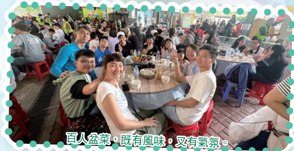
百人盆菜，既有風味，又有氣氛。