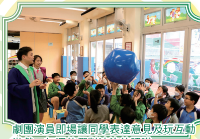
劇團演員即場讓同學表達意見及玩互動遊戲，加深他們對法治的認識。