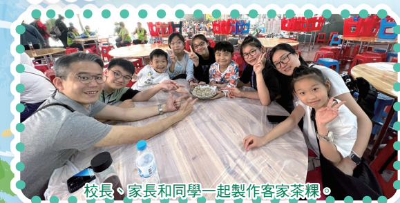
校長、家長和同學一起製作客家茶粿。