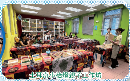
土耳其小枱燈親子工作坊