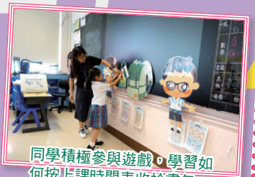
同學積極參與遊戲，學習如何按上課時間表收拾書包。

為了提升學生的自理能力，本校於一年級課程中加入自理元素，教導學生如何按上課時間表收拾書包、抹桌子及使用筷子等。自理課程不僅在於提升學生的基本生活技能，更可培養他們的獨立性和適應能力。自理課程的課堂採用互動式教學方法，包括角色扮演、遊戲和小組討論等，讓學生在輕鬆愉快的環境中學習。