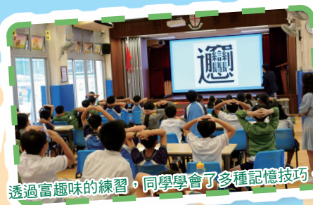
透過富趣味的練習，同學學會了多種記憶技巧。