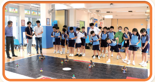
同學學習操作Raspberry Pi、機械人及AI對話小助手，活動不僅能增強學生的STEAM知識，還能促進創新思維和合作能力。