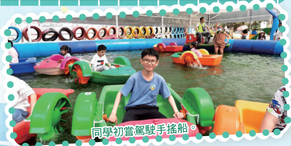
同學初嘗駕駛手搖船。